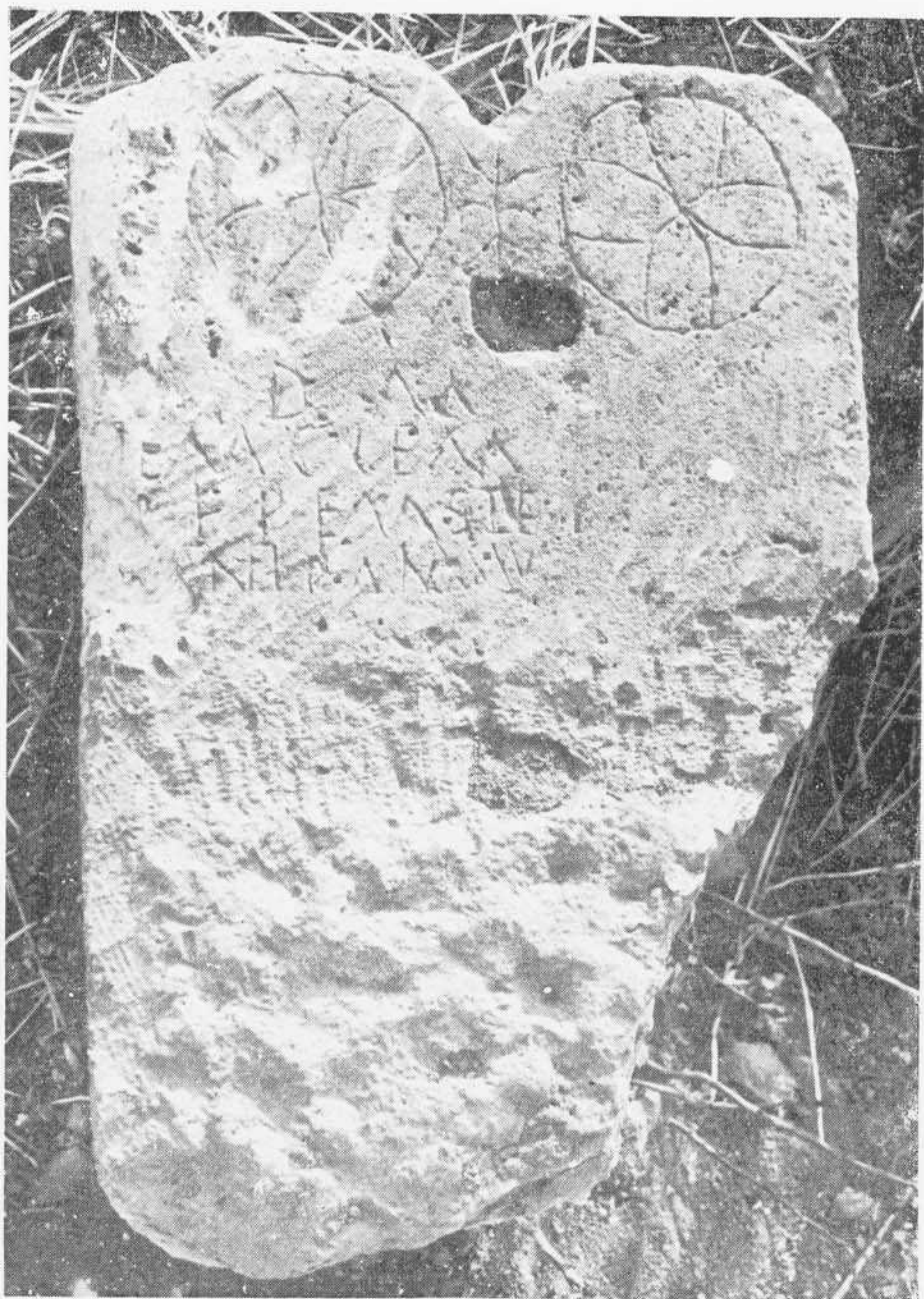
Estela funeraria de Belbimbre (Burgos).