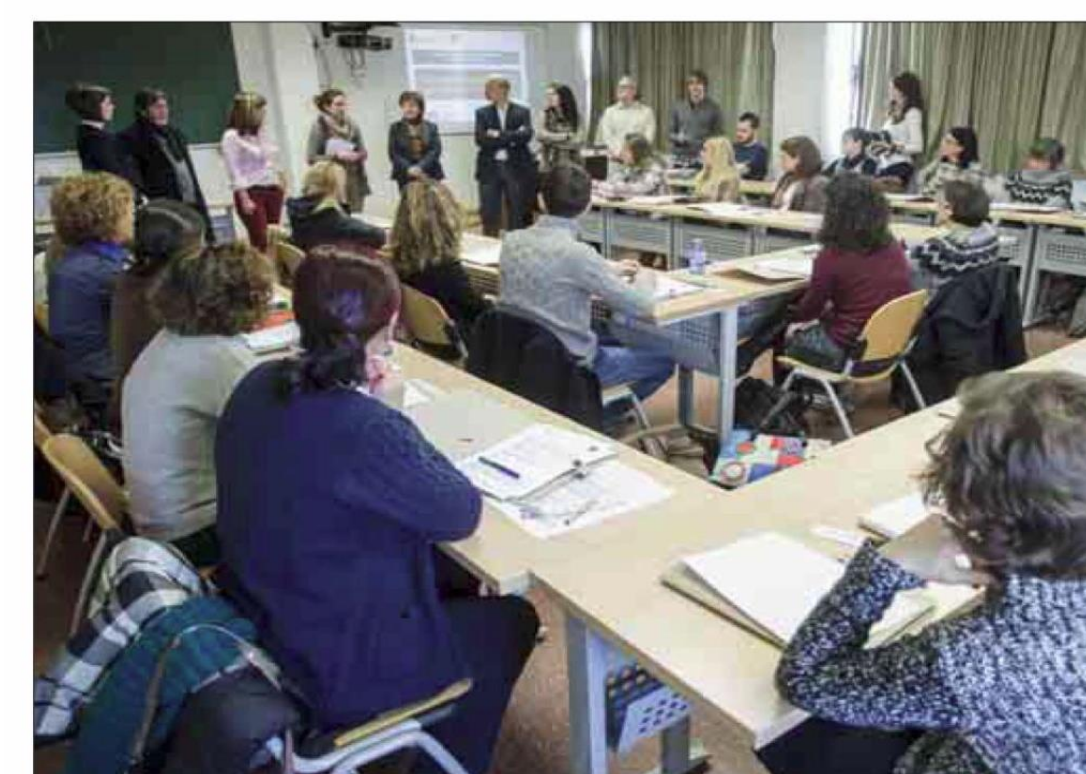
Un momento de la presentación de la Escuela de Investigadores, ayer, en la Facultad de Educación.