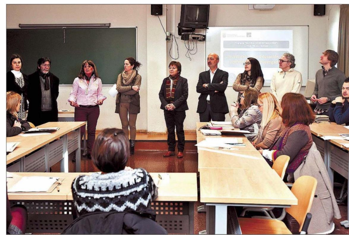
Escuela de Investigadores. La Facultad de Educación de la UBU acogió ayer la primera jornada de la primera fase del Programa Escuela de Investigadores, en el que participan 30 profesores de centros de Educación Infantil, Primaria y Secundaria de Castilla y León. Se trata de un programa de innovación educativa de la Junta que busca experimentar nuevas metodologías de formación del profesorado.

Fecha: 27/01/15 Sección: Burgos Página: 14