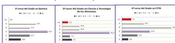
Figura 4. Respuestas para la CT "Compromiso ético y responsabilidad social".

Respecto a la CT "Conocimientos de informática y TIC relativos al ámbito de estudios", Figura 3 , llama la atención el número tan elevado de los alumnos de GII que no contesta (46,7%) y del resto de ellos la mitad (26,7%) la consideran muy importante valorándola con un 5.