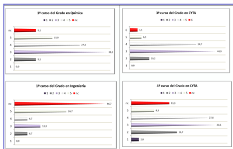
Figura 3. Respuestas para la CT "Conocimientos de informática y TIC relativos al ámbito de estudios".

Respecto a la CT "Conocimientos de informática y TIC relativos al ámbito de estudios", Figura 3 , llama la atención el número tan elevado de los alumnos de GII que no contesta (46,7%) y del resto de ellos la mitad (26,7%) la consideran muy importante valorándola con un 5.