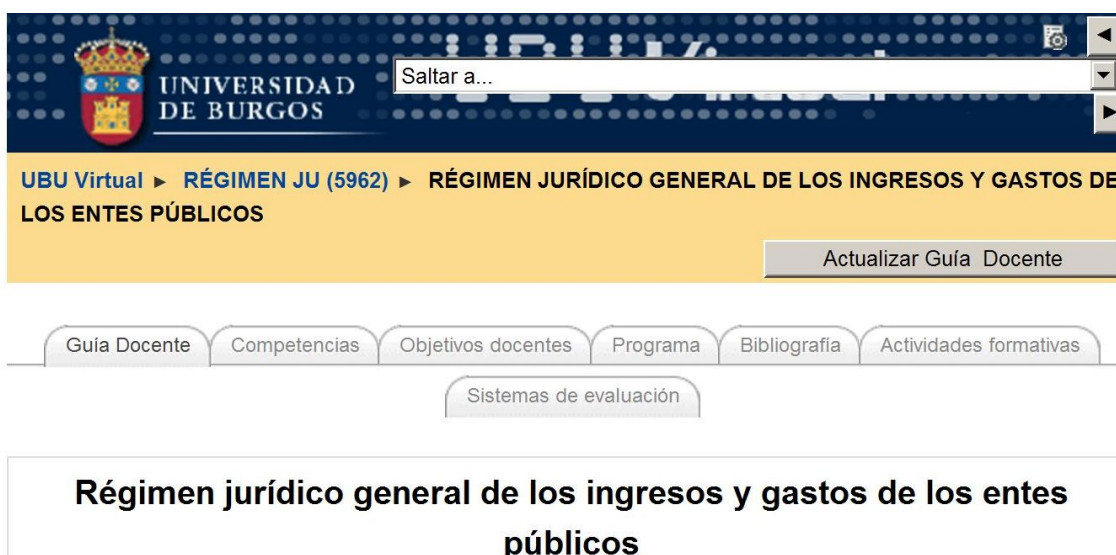
Figura 2: Aplicación para cumplimentar la guía docente.