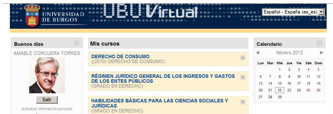
Figura 1: Vista general del acceso a UBUVIRTUAL.