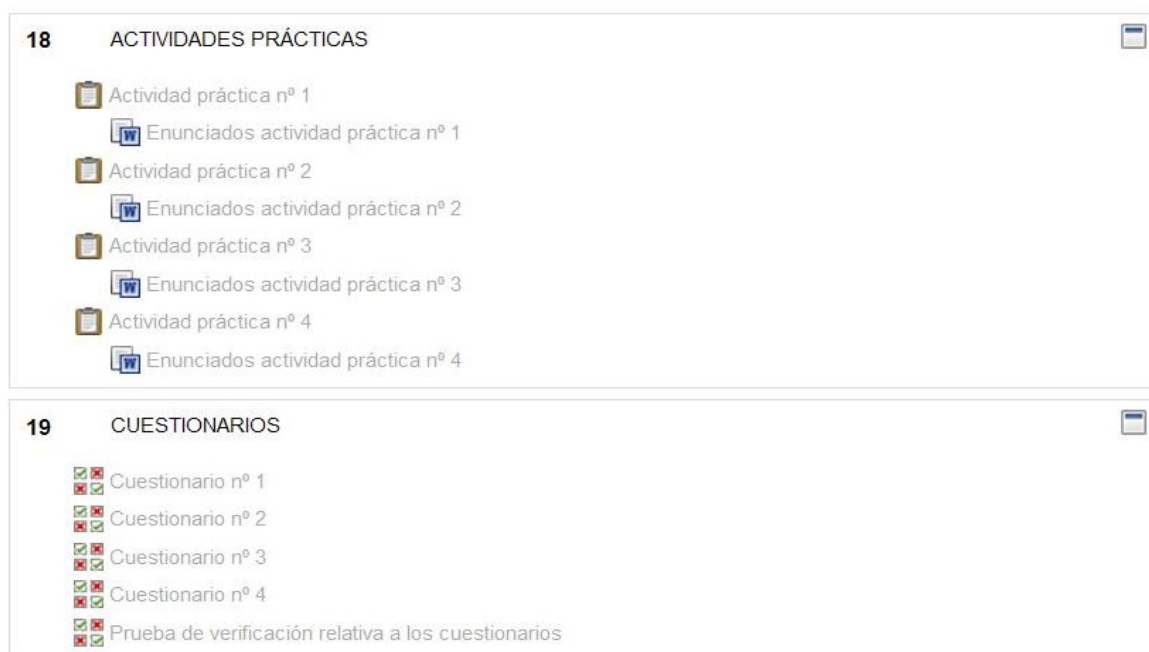
Figura 6: Actividades de evaluación continua en UBUVIRTUAL (Moodle).

Las actividades de evaluación continua (Figura 6) permiten al profesor y al estudiante realizar un seguimiento del progreso de la asignatura, utilizándose en el caso que nos ocupa actividades de resolución práctica a través de Moodle (opción “Tareas: Subir un solo archivo”), cuestionarios on line y pruebas de verificación presenciales, como se verá en el apartado 3.3 de esta comunicación.