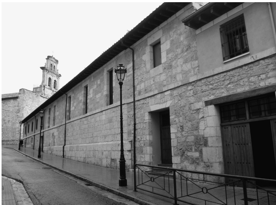
Calle del Emperador. Monasterio de S. José. MM. Benedictinas, donde estuvo situada la Casa-Galera de Burgos

En la guerra fratricida entre el rey Pedro I y su hermanastro Enrique II el edificio quedó muy maltrecho, lo que motivó que el Trastámara indemnizara al hospital con un censo de 2.000 maravedíes anuales. Se reedificó en 1570, y el cardenal Zapata trasladó en 1601 a las monjas benedictinas del convento de San Cebrián de Los Ausines a los edificios antiguos de este hospital, que jamás conocería ya la