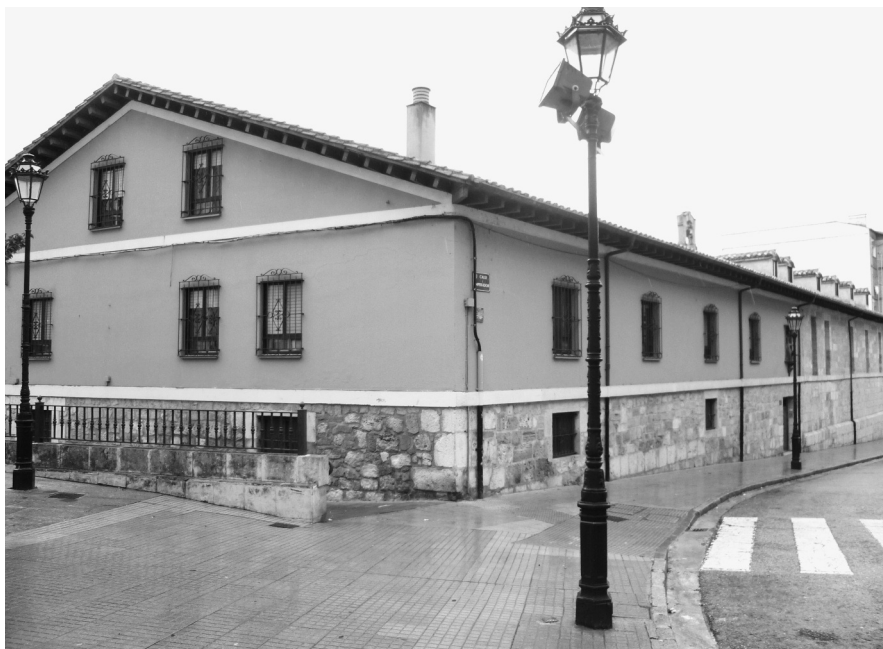
Calle del Emperador. Monasterio de S. José. MM. Benedictinas, donde estuvo situada la Casa-Galera de Burgos

razones por las consecuencias de orden penal que podría acarrearle el que alguna reclusa se fugare. Además, el presupuesto anual de la Casa-Galera era elevado (14.148 reales y 27 maravedíes) y las “rematadas” eran treinta y seis mujeres.