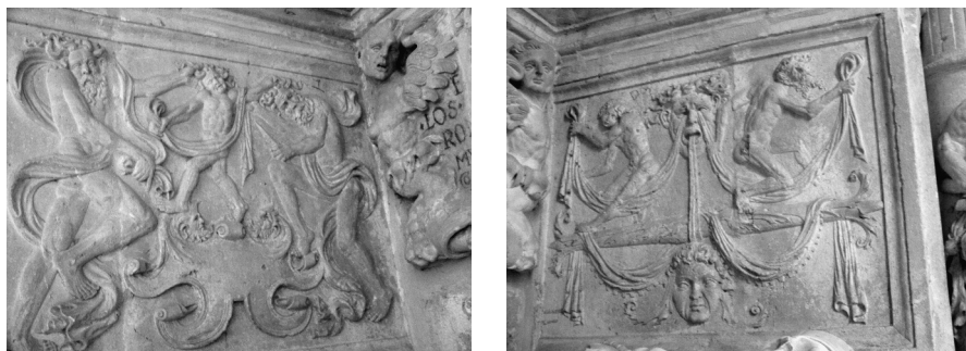
Plafones bajos del intradós: lados izquierdo y derecho

honrar a los yacentes, su prestigio social y virtud religiosa, y mostrarles como un modelo a seguir por sus descendientes (45).