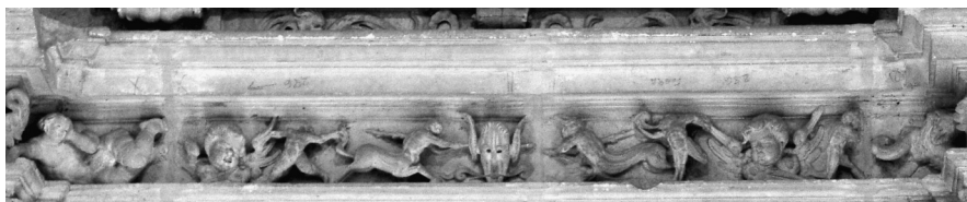
Cuerpo central, friso dedicado a Ariadna

que domina a un caradio (48), es decir en ambos casos se subraya la salvación del alma a través de las creencias cristianas. La idea de ensalzar el triunfo del bien se ha propuesto recientemente como explicación de los relieves (49), basando la misma en la confrontación entre el bien y el mal representada por la oposición de imágenes en los citados casetones. Esta interpretación es válida desde una visión general, si bien es difícil establecer la secuencia de las imágenes de contrarios porque las presentes en este sepulcro se caracterizan por sus repetitivas formas híbridas (50) –casi todas con rostros diabólicos y sin atributos específicos– y por su distribución aleatoria en los casetones donde alternan con dragones, centauros, gimnastas y acróbatas. Por este motivo nos inclinamos a relacionarlas con la vertiente más simbólica del pensamiento del s. XVI que las interpretaba como divinidades psicopompas destinadas a conducir las almas en su viaje hacia el más allá. En este mismo sentido se han valorado los dos relieves masculinos situados debajo de los telamones, en la base del sepulcro, que se han identificado con la representación de los