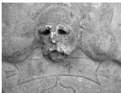
Arca sepulcral y detalle con la fecha

mantiene el típico reborde de rollos (32). En el centro del arca, en la parte superior, se sitúa hacia abajo el torso de un sátiro agarrando ambos emblemas con sus manos y por delante de su cabeza hay una cartela ansata con el año 1548. Los laterales se decoran con motivos de candelieri con una máscara de león en el centro, seguidos de dos relieves de figuras masculinas de robustas anatomías y en posiciones muy forzadas que parecen sustentar a los telamones de las ménsulas. Por encima hay un entablamento que sirve de apoyo al siguiente cuerpo.