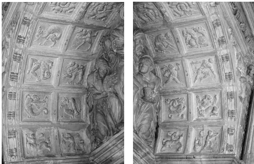
Relieves del intradós: filas 1 a 5 y filas 5 a 9