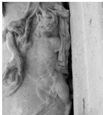
Columnas del cuerpo central, detalles