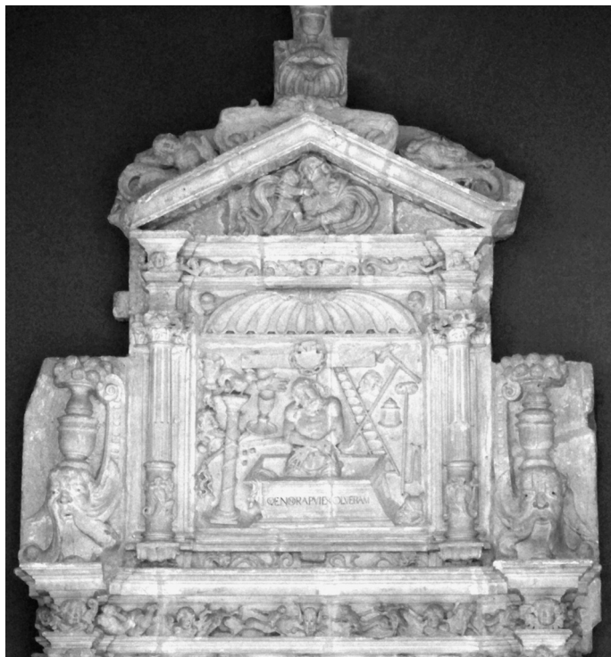
Edículo, cuerpo superior