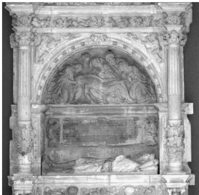
Nicho funerario, cuerpo central

por sirenas, una de rasgos ancianos femeninos y otra de rasgos juveniles masculinos (33), las esculturas yacentes del matrimonio Sarmiento-Mendoza sobre el arca y, de nuevo, paneles con figuras profanas en los laterales del intradós.