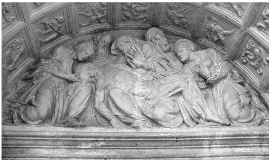
Relieve: Llanto sobre Cristo muerto