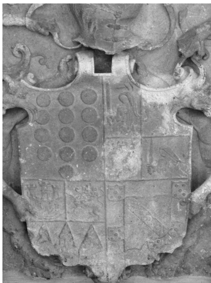
Escudo de Antonio Sarmiento