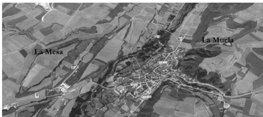
Fig. 1: Situación geográfica de los yacimientos de La Muela y La Mesa

Por su lado, La Mesa, con una extensión de unas 23 ha y situado a 840 msnm. Sus coordenadas son 42^{\circ} 25' 40'' N y 3^{\circ} 11' 54'' E. Se trata de una pequeña meseta totalmente llana situada en el interfluvio formado por los ríos Tirón y Retorto, a unos 250 m. de forma equidistan-