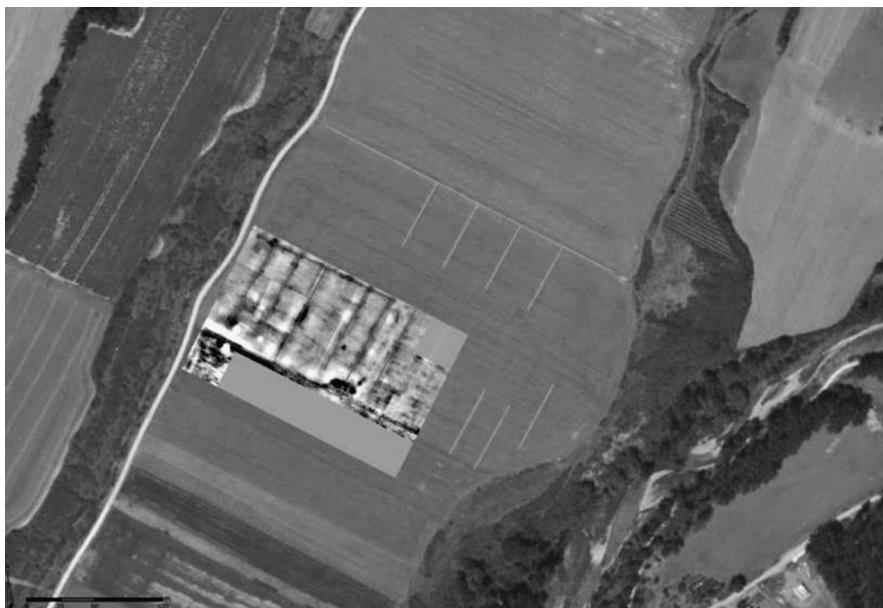
Fig. 3: Imagen de “La Mesa”, con los resultados de la prospección sobrepuestos

operario durante la prospección y substituirlo por un valor medio a partir de los valores adyacentes. El segundo filtro utilizado es el High Pass, que reduce los valores superiores para facilitar un mejor contraste entre alta y baja resistividad. La imagen 4 ilustra las modificaciones observadas con la aplicación de los dos filtros.