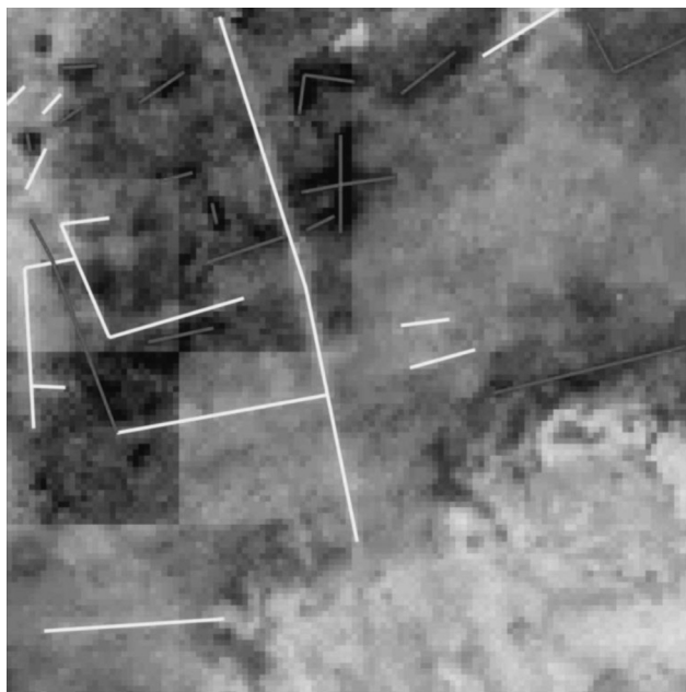
Fig. 2: Interpretación de los resultados de la resistividad con la aplicación de filtros despiking y lowpass en el yacimiento de La Muela

tado la mayor concentración de material en superficie, focalizando además en el punto en el que la fotografía aérea parecía revelar la presencia de diversas anomalías.