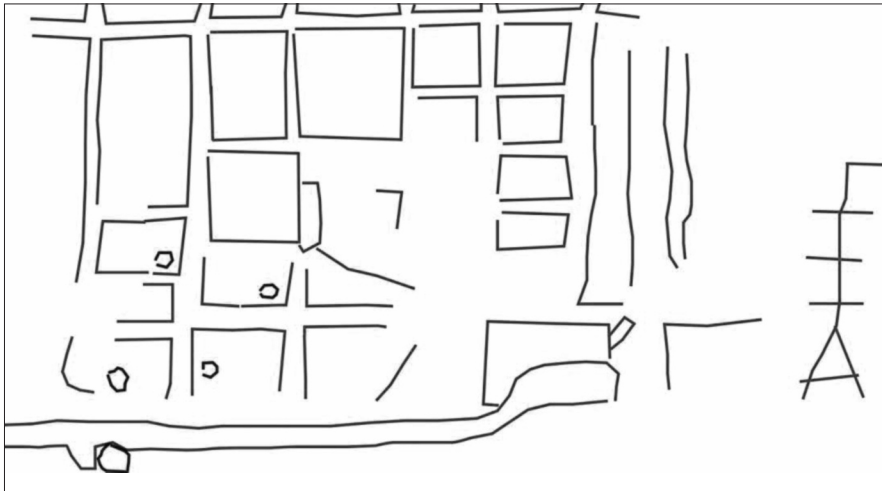
Fig. 5: Interpretación de las posibles estructuras del subsuelo según la prospección geofísica de La Mesa.

En definitiva, pues, los resultados de la prospección geofísica fueron positivos en ambos casos. Si bien para La Muela no permiten determinar con claridad ante qué tipo de asentamiento nos encontramos y, de hecho, más bien estaríamos ante un indicio de que quizá no nos encontraríamos ante un núcleo de primer orden (tipo castro),