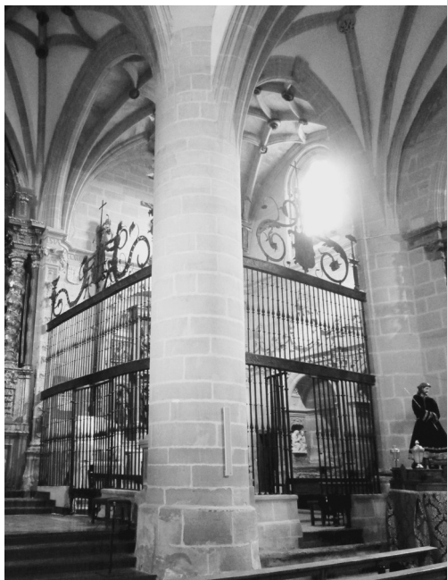
Vista de la capilla de santa Ana y Santiago desde el crucero

La capilla, situada en la cabecera en el lado de la epístola, tiene en uno de sus lados la sacristía. Todo el conjunto está dotado de una gran unidad y destaca por la calidad de su factura. Dos espléndidas rejas la ponen en comunicación visual con el presbiterio y con la nave lateral. Arquitectura y escultura están concebidas a la vez. Una gran bóveda de nervios estrellada cubre el espacio único y se apoya sobre una elegante cornisa en la que se haya una inscripción a la que me referiré más adelante.