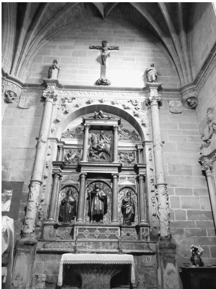
Retablo de la capilla

El muro de la derecha está articulado de una manera elegante y plástica para ordenar dos arcosolios y la puerta de acceso a la sacristía. La composición se organiza por medio de cuatro columnas que sostienen un entablamento coronado por una composición vegetal y aérea que tiene en el centro las armas del fundador. Se puede detectar la huella del estilo decorativo de Siloe, tan presente en muchas de las obras burgalesas. 18 Puerta y sepulturas están tratadas de una