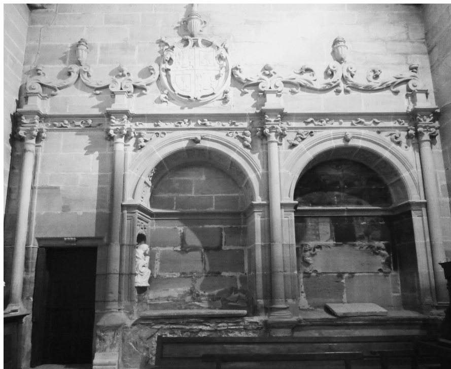
Sepulcros del fundador y del patrono y puerta de la sacristía

MARRON INQUISIDOR DE VALLADOLID E CANONIGO DE ÇAMORA E BENEFICIADO DE ESTA IGLESIA E NATURAL DE ESTA VILLA AÑO 1555”.