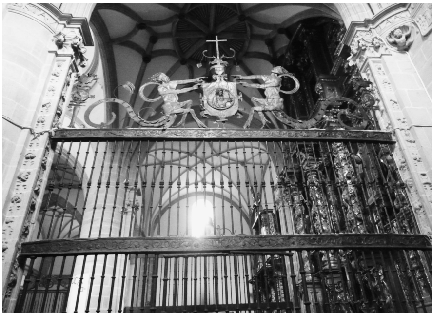
Reja de la capilla hacia el presbiterio

antes de que Don Gonzalo Monte fundara su capilla, 25 el taller que se formó en torno suyo agrupó a numerosos rejeros que extendieron su influencia por toda Castilla 26 . Los ecos de sus obras se observan claramente en las de Belorado. 27 En la capilla ambas rejas cumplen la función de verdaderas fachadas con su rica decoración de roleos,