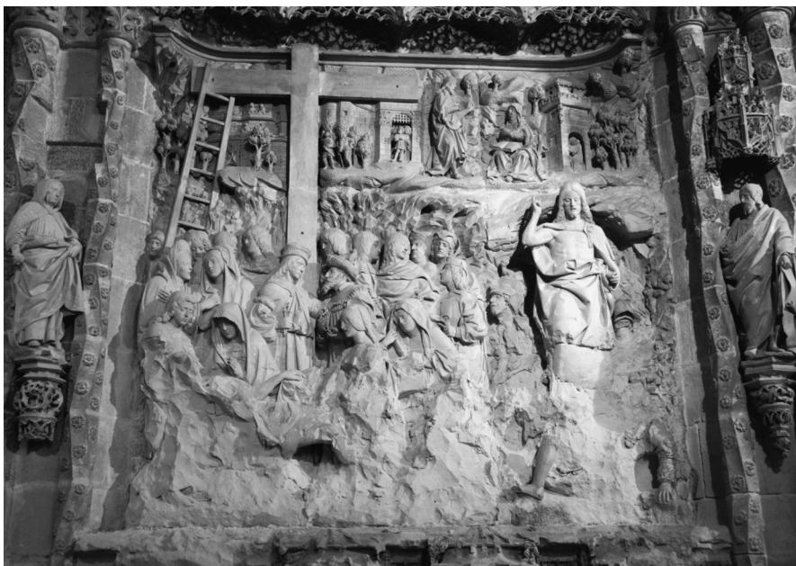
Fig. 3. El Descendimiento