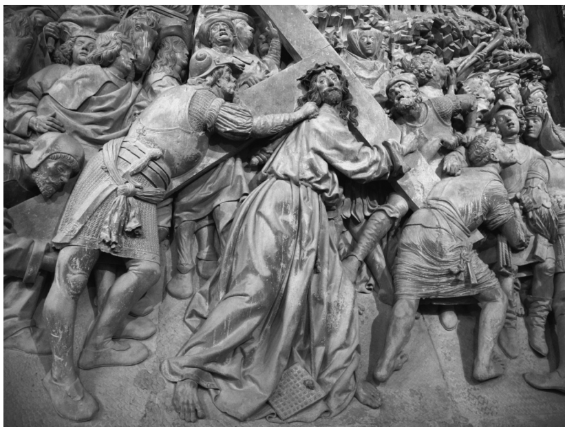
Fig. 6. Camino del Calvario (detalle)

nografía, tanto entre personajes judíos como en aquellos que representan a cristianos, bonetes con una vuelta, ésta a su vez lleva varios cortes que se enroscaban hacia dentro o hacia afuera. En el Museo de Burgos hay una tabla del Maestro de Budapest, dedicado al martirio de San Lorenzo, donde un sayón lleva un bonete con dos vueltas cuyos bordes van enroscados. La tabla está datada hacia 1475.