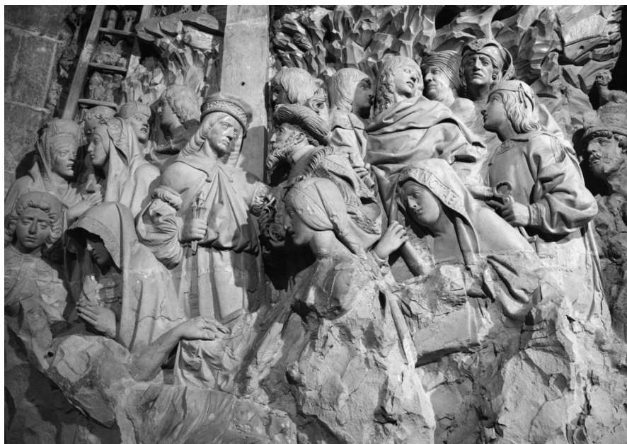
Fig. 5. El Descendimiento (detalle)

Interesante es la melena al modo italiano, perfectamente peinada, lisa, con las puntas metidas hacia dentro y flequillo. Podemos afirmar casi con toda seguridad que es una peluca. Era propio de nobles y gente de la alta burguesía. El uso de pelucas estuvo de moda en Italia desde los años setenta y a España llegaría a finales del siglo XV. Durará hasta las primeras décadas del siglo XVI. Los postizos estaban hechos de lino, lana, algodón o seda 13 .