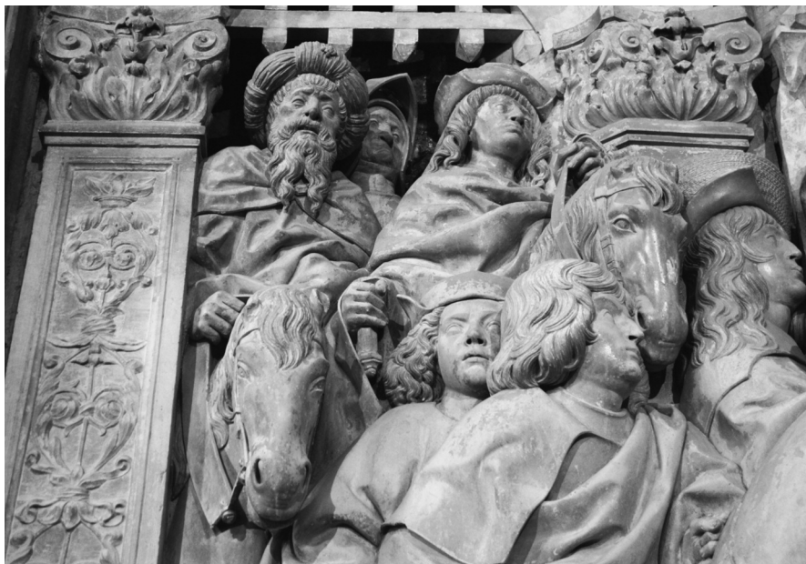
Fig. 7. Camino del Calvario (detalle)

En el Camino del Calvario hay un hombre de aspecto joven [Fig. 7], con ropa holgada y con el cabello largo y rizado, que lleva gorra rígida con pliegues radiales en la copa.