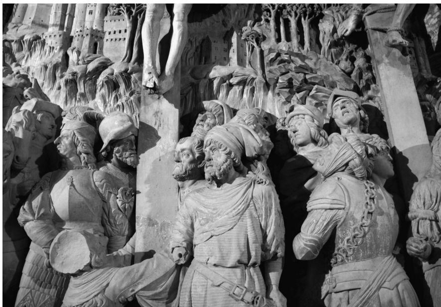
Fig. 4. La Crucifixión (detalle)

En la Crucifixión hay un personaje vestido a la romana [Fig. 4] cuyo bonete con forma de bolsa lleva una vuelta y el extremo caído a un lado. Lleva una borla grande. Este adorno fue moda de mediados del siglo XV, llevándose sobre todo en los sombreros 10 . En este caso, como en los otros que iremos viendo, la borla posiblemente servía como complemento para teatralizar a los personajes.