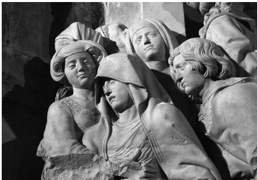
Fig. 8. La Crucifixión (detalle)

En la Crucifixión [Fig. 2], la Virgen María lleva una toca oculta casi por completo por el manto, que pasa por delante del cuello. También María Magdalena, quién la lleva colocada sobre los hombros.