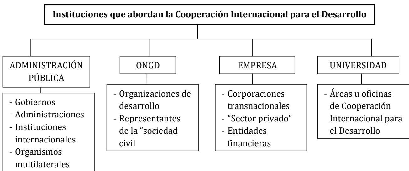
Figura 1: Instituciones que abordan la Cooperación Internacional para el Desarrollo

La Cooperación Internacional para el Desarrollo es un campo el cual es abordado por diferentes instituciones u organizaciones, tanto de origen público como privado. Estas son: la Administración Pública, las ONGD, las Empresas y la Universidad.