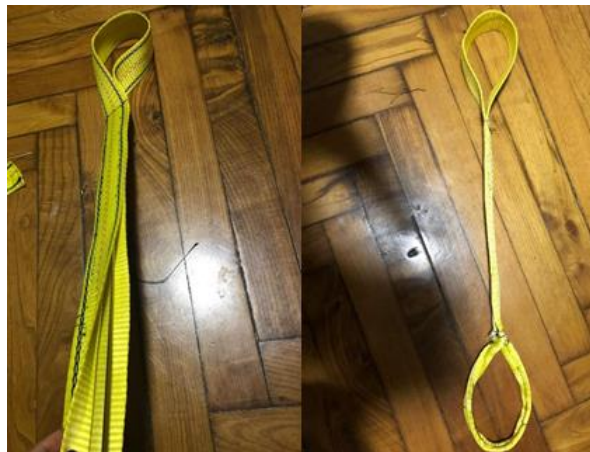
Figura 1: Loneta, pletina, y producto cosido.

El proceso que se siguió es el siguiente: En primer lugar, con aguja e hilo se cosieron las correas introduciendo la pletina metálica dentro de ellas, siendo el soporte del producto (Figura1).