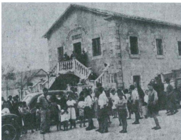
La Voz de Cantabria , 6 de septiembre de 1936.

www.arija.org/es/index.php?title=La_Voz_de_Cantabria_1936