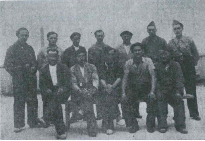
La Voz de Cantabria , 7 de septiembre de 1936.