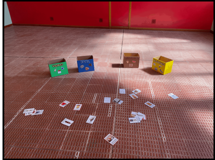
Imagen 6: carrera de reciclaje.