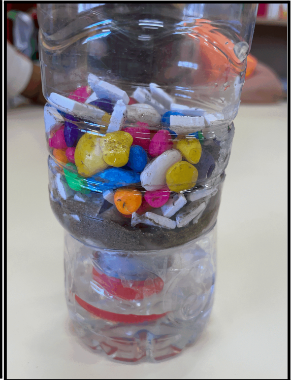
Imagen 10: resultado filtro.