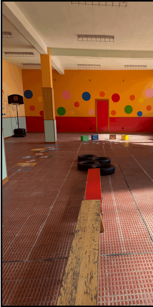
Imagen 5: Circuito del reciclaje.