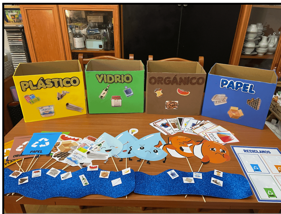
Imagen 1: materiales para el teatro.