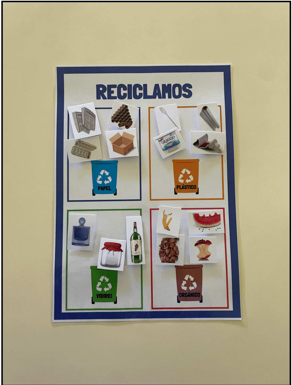
Imagen 4: ficha contenedores.