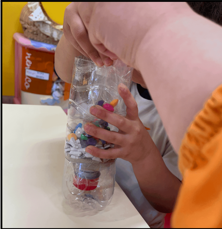
Imagen 9: filtro en proceso.