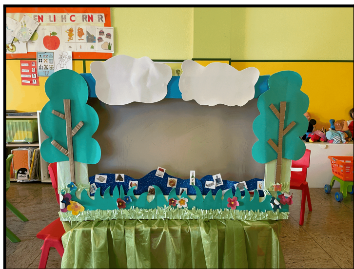
Imagen 2: escenario con el río sucio.