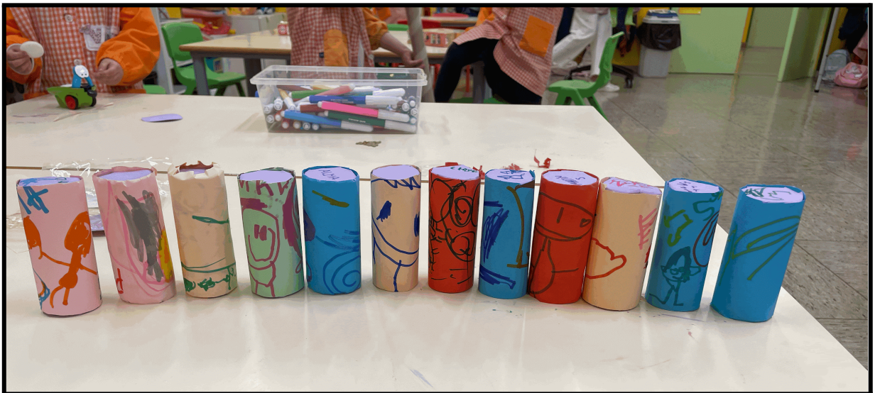
Imagen 11: resultado de los palos de lluvia.