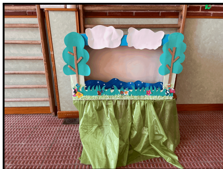
Imagen 3: escenario con el río limpio.