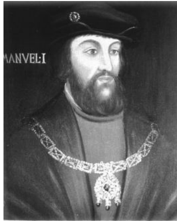
Retrato anónimo del rey Manuel I de Portugal, el Venturoso o el Afortunado, padre de la infanta María.