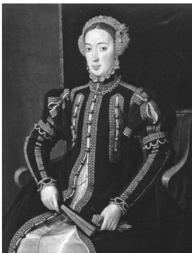
Retrato de la infanta María de Portugal, duquesa de Viseu, por Antonio Moro, ca 1550-1555, Monasterio de las Descalzas Reales de Madrid (dominio público).