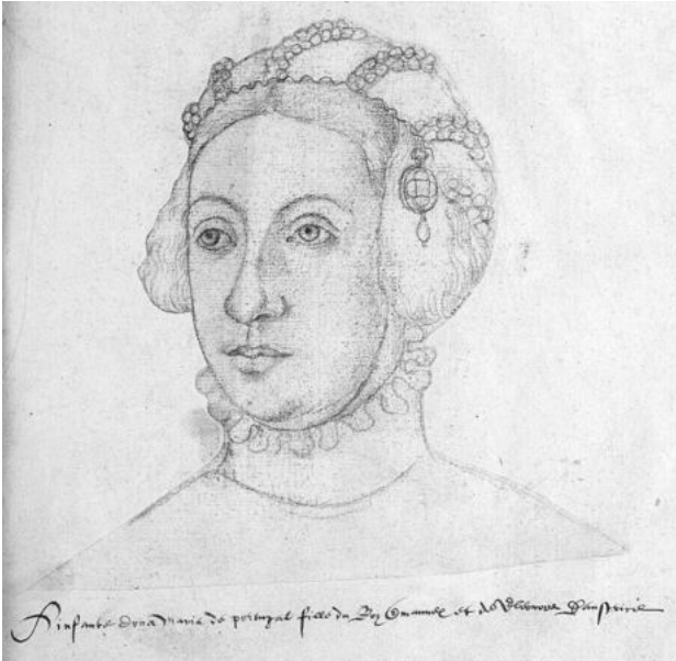
Retrato de María de Portugal, duquesa de Viséu, en la Recopilación de Arras del siglo XVI , una colección de 289 dibujos de retratos copiados sobre todo por Jacques de Boucq, ca. 1570 (dominio público) 53 .

Pero uno de los fenómenos más curiosos de este renacer del espíritu entre las mujeres fue la brevedad de su existencia: no duró siquiera una centuria. En la segunda mitad del siglo XVI, el espíritu que sustentaba esta fuerza que parecía imparable, dada su brillantez, comenzó a decaer y desaparecer, aunque se prolongó hasta finales de la centuria 52 . Un ejemplo de su decadencia fue el de la propia Luisa Sigea, quien casada en España trató de incorporarse a la corte de Madrid. A pesar de las recomendaciones de la infanta y la admiración que suscitaba en María de Hungría, fue rechazada en la corte española. Es más, el propio Felipe II no mostró ningún interés por estas mujeres intelectuales.