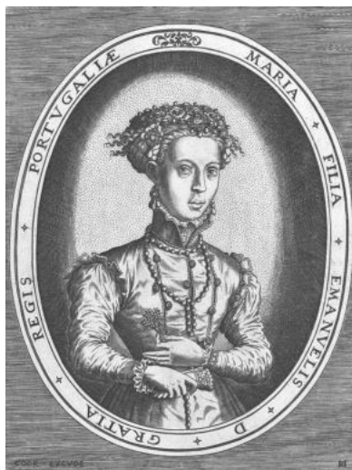
Retrato de la princesa María, duquesa de Viseu, por Hieronymus Cock, 1554-1556 (dominio público).

Desde 1537, cuando la infanta cumplió los 16 años, el rey dispuso una casa propia para su hermanastra. Aquellas casas de los infantes fueron importantes, pues además de concederles una cierta independencia al separarles del palacio real, se les facilitaba que pudieran rodearse de caballeros y damas de la más selecta nobleza del reino 34 . Al disfrutar de libertad respecto a la corona, los monarcas portugueses, fundamentalmente Juan III, procuraron controlarlas, particularmente a través de las políticas matrimoniales. Muchos testimonios coetáneos y posteriores se hicieron eco de la altura intelectual y moral que rigió aquella corte realzando la figura de la infanta y de las damas que la acompañaban. Damiao de Góis señalaba en 1567 sobre la corte de la