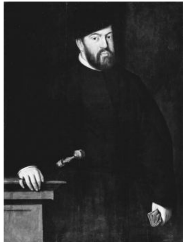
Retrato del rey Juan III de Portugal, hijo de Manuel el Afortunado y hermanastro de María de Portugal, por Antonio Moro.