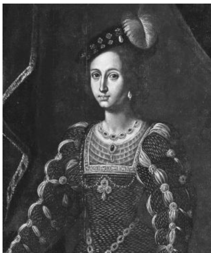
Beatriz de Portugal (1504-1538), hija de Manuel I y María de Aragón, casada con el duque de Saboya. Pintor piemontés desconocido.

Otro gran humanista de la época fue Juan Rodrigues de Sá de Meneses, el Viejo (1482-1579). Educado por Cataldo 5 , despuntó como militar, diplomático y poeta portugués. Sirvió al rey Manuel I y especialmente al infante Alfonso (1509-1540), convirtiéndose en un gran humanista y poeta de calidad que participó también en el Cancioneiro Geral de Resende y en la Historia de Portugal . Como militar contribuyó a la defensa de Tánger (1511) y en otros acontecimientos bélicos hasta que el rey lo envió en 1516 como embajador a la corte de Castilla ante Fernando II de Aragón 6 . En 1521, formó parte de la delegación que acompañó a la infanta Beatriz a la corte de Saboya, retirándose a Oporto, poco después, tras el fallecimiento del rey Manuel I.