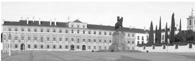
Palacio del duque de Bragança en Vila Viçosa.

La casa de Bragança, la segunda más poderosa después de la familia real, creó desde principios del siglo XVI un importante centro cultural en Vila Viçosa, en el corazón del Alentejo 7 . El palacio de esta corte floreciente fue proyectado inicialmente de estilo renacentista e inspirado en el palacio de la Ribeira de Lisboa. En 1501, el IV duque de Bragança mandó reconstruirlo edificando un nuevo palacio residencial cuya característica principal fue su fachada monumental.