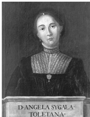
Retratos de Luisa y Ángela Sigea, por Dionisio Santiago Palomares, pintor toledano del siglo XVIII, depositados en el Alcázar de Toledo.

Su obra de mayor calado fue el Coloquio de dos doncellas sobre la vida en la corte y la vida retirada , publicada en 1552 y también dedicada a la infanta María de Portugal. Escrita en forma de diálogo, la obra se hace eco del tema “menosprecio de corte y alabanza de aldea”, tan en boga en el siglo XVI, y trata del dilema sobre “el modo de vida más feliz: el de la corte o el de la vida retirada, al margen del tumulto urbano”.