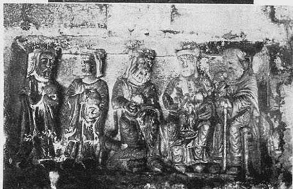
P.º 510. N.º 1 - Butrera. Abside de la Iglesia, siglo XII.