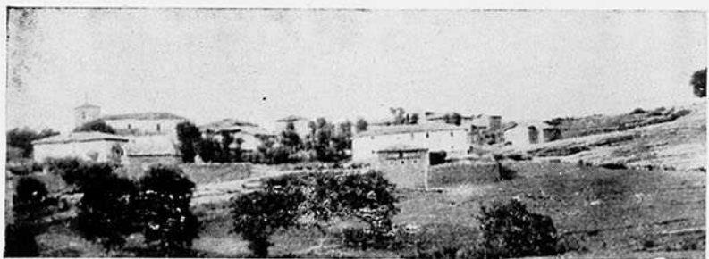
1.ª — RETRATO DE DON JUAN DE GARAY 2.ª — VISTA PANORÁMICA DE VILLALBA DE LOSA

(Corresponden al artículo del Sr. Miguel Ojeda).