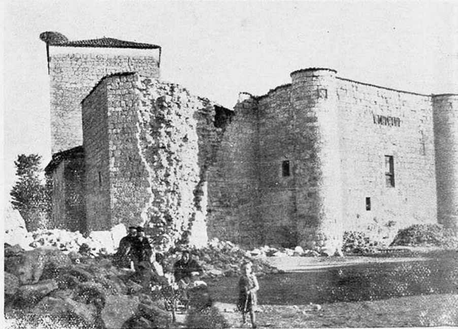
VIVAR DEL CID.—Molino de familia. CABIA.—Señorío del Cid.