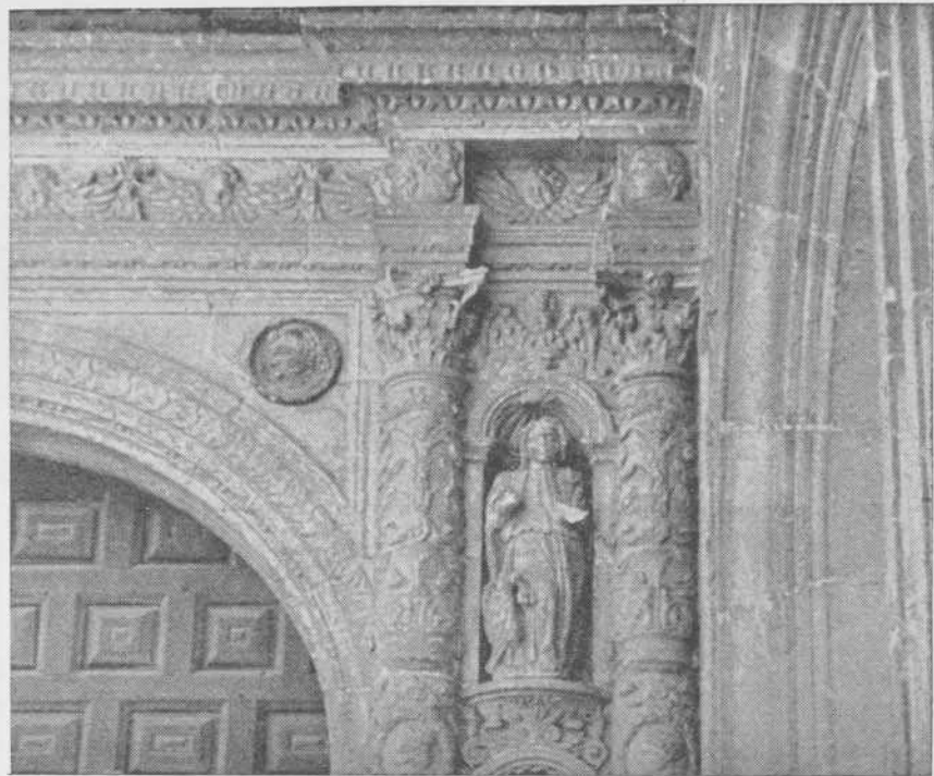
Lámina II.—4 y 5. - SANTA MARIA DEL CAMPO (Burgos). Portada en el primer cuerpo de la torre. Obra documentada de Diego de Siloe.