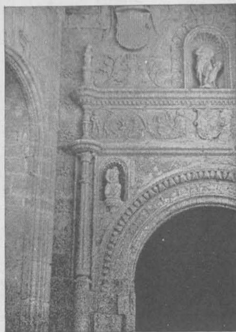
Lámina II.—1, 2 y 3. - SANTOYO (Palencia). Portada de la iglesia y detalles. Obra probable de Diego de Siloe.