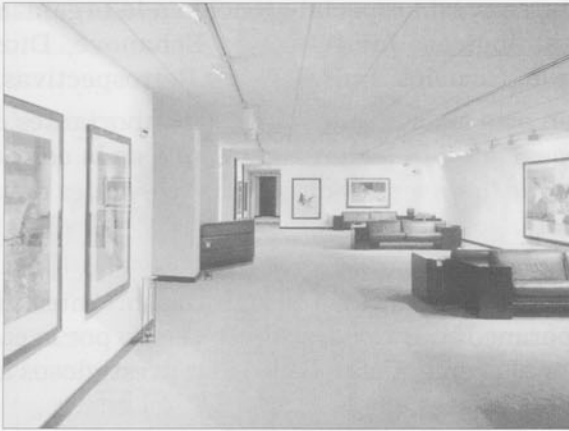
Sala de Exposiciones de la Casa del Cordón

La Caja de Ahorros Municipal de Burgos , tras introducirse en esta labor con la apertura de su primera Sala, Arlanzón , a la cual ya nos hemos referido anteriormente, ha continuado su labor de promoción artística a través de la puesta en funcionamiento de otras tres salas más.