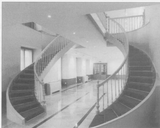
Sala de Exposiciones del Teatro Principal