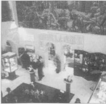
Vista parcial de la Sala de Exposiciones del Arco de Santamaría

La emblemática puerta fue convertida a partir del 15 de octubre de 1994, gracias a la iniciativa municipal, en un magnífico Centro Cultural Histórico Artístico, en el que, junto a un pequeño museo de temática cidiana y una exposición permanente sobre la botica del antiguo Monasterio de San Juan, se ha reservado un espacio destinado a Sala de Exposiciones, siempre presidida por el polémico mural de Vela Zanetti.