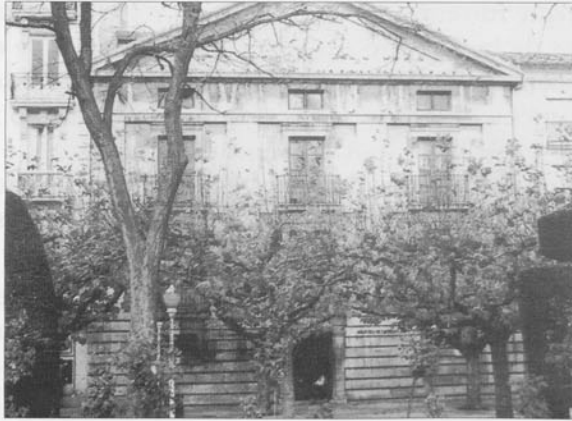
Edificio del Consulado de Mar, donde se ubica la Academia de Dibujo, la Sala de Exposiciones y la Institución Fernán González