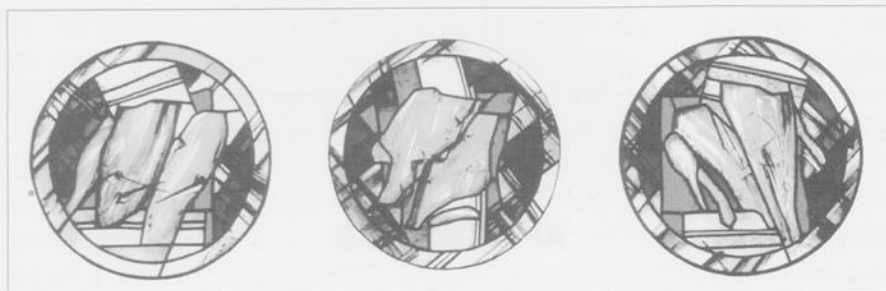
Óculos del conjunto vitral de la Capilla Mayor. Detalle

Recogen algunos de los elementos y símbolos de la Pasión de Cristo: los clavos –en el óculo Norte–, las espinas –en el óculo central–, la lanza y la esponja –en le Sur–.