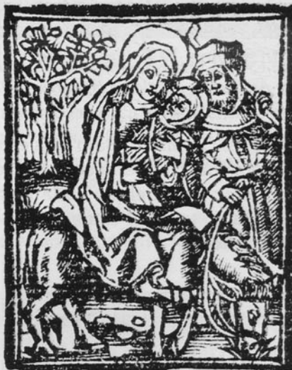
Grabado ilustrativo que acompaña la edición facsímil de 1948