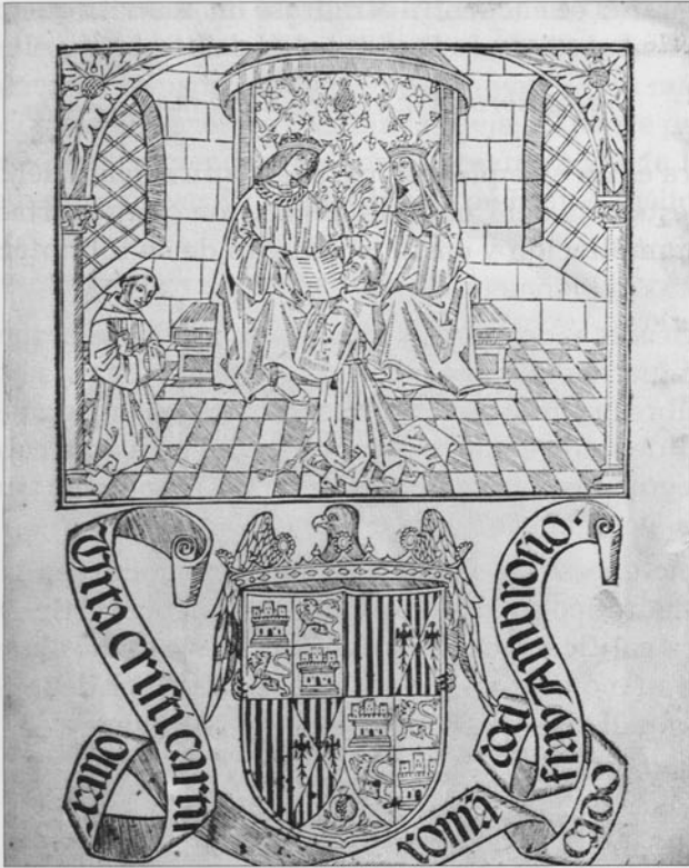
Vita Cristi Cartuxano romanceado por Fray Ambrosio. Alcalá de Henares. 1502.

trando el libro a los Reyes Católicos. Bajo esta escena se sitúa el escudo real enmarcado por una filacteria en que se dispone el título y el nombre de su traductor. Ya en el pie de la hoja, se encuentra la misma frase manuscrita vista en el tomo en que se encontraba el “Auto de la huida a Egipto”.