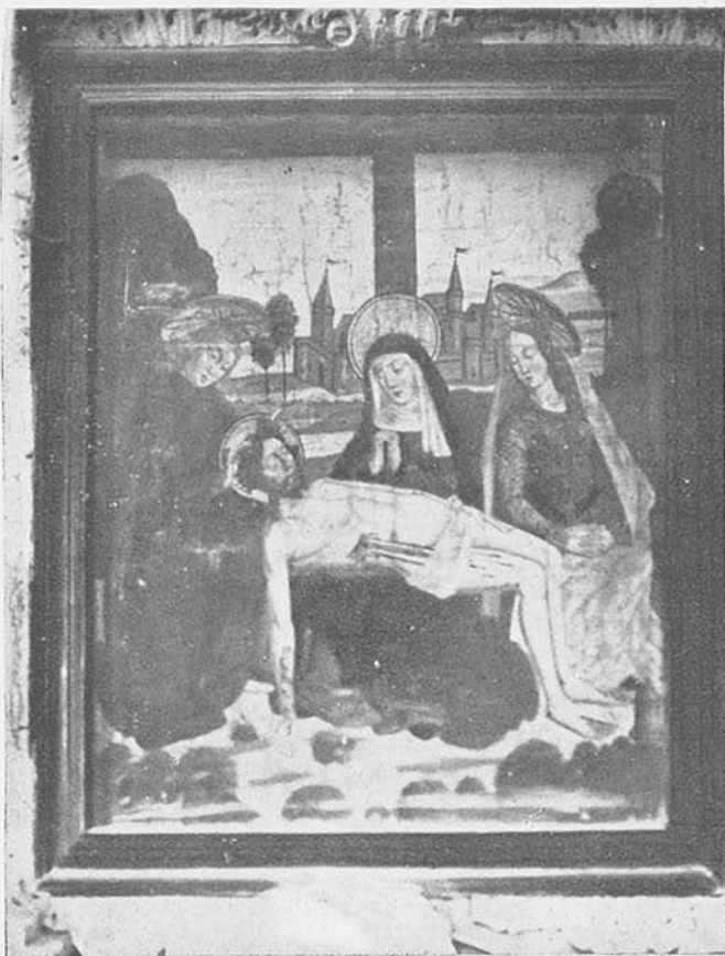
Fotogr. núm. 2.—BURGOS: IGLESIA DE SAN NICOLAS. Jesús en brazos de su Madre.—El maestro de San Nicolás.