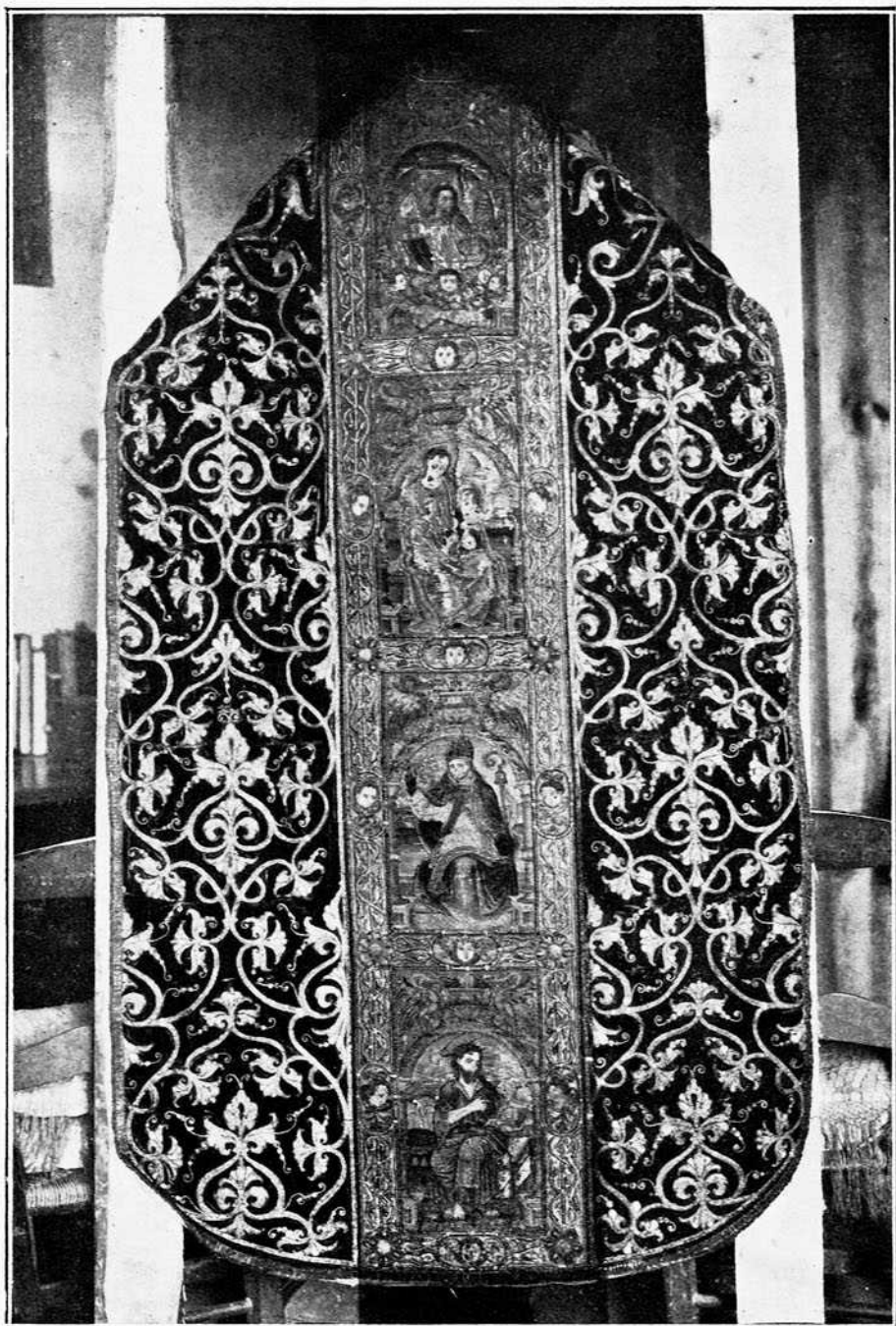
Casulla de la Iglesia de San Millán, de los Balbases (Burgos)