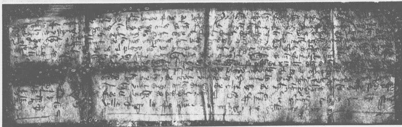
Fot. núm. 6.—Documento judeo-castellano de 1362. Villahizán de Treviño (Villadiego) (reverso).