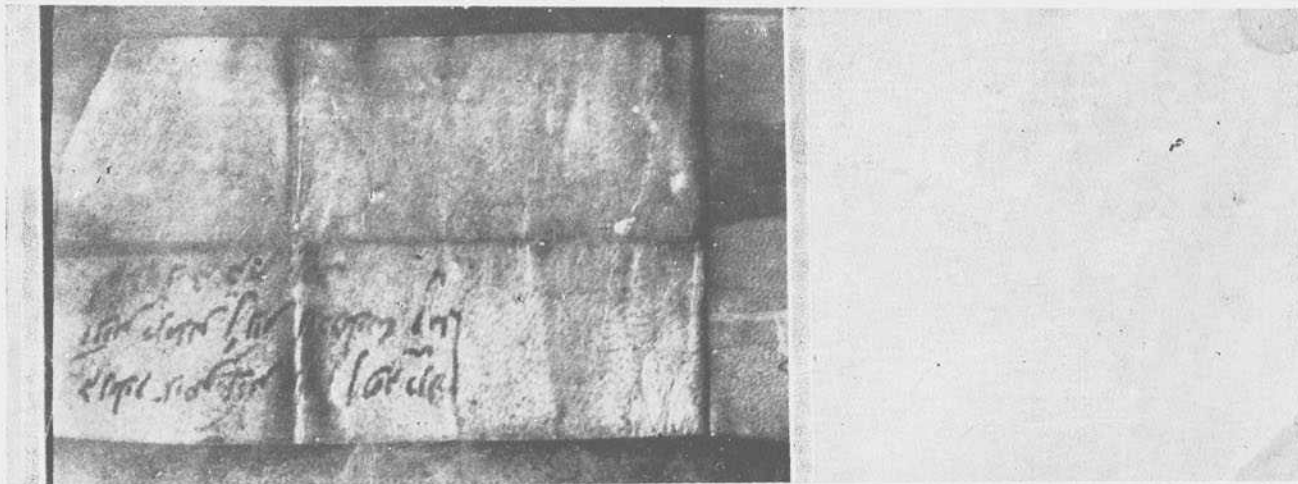
Fot. núm. 6.—Documento judeo-castellano de 1362. Villahizán de Treviño (Villadiego) (anverso).