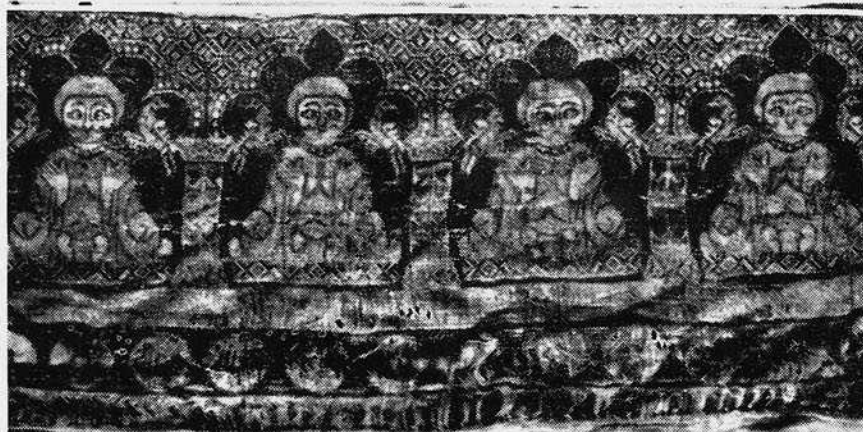
Fotogs. núms. 1 y 2.—Casulla y orla del alba que usó San Juan de Ortega.