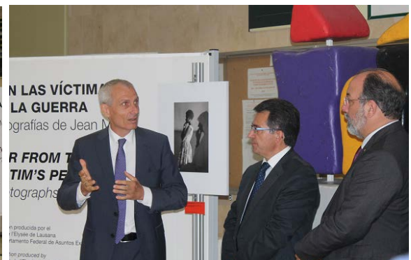
(14 de julio de 2015)