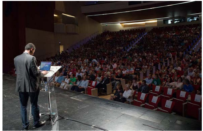
(10 de julio de 2015)

✦ “Con las Víctimas de la guerra” Inauguración de la exposición de fotografías de Jean Mohr bajo la tutela y organización del curso de verano “El derecho Internacional Humanitario y la protección de las víctimas de guerra”. El rector junto con el Embajador de Suiza en España y el Presidente de Cruz Roja Española en Burgos y acompañados de numerosas autoridades locales y académicas rindieron un homenaje a las víctimas de la guerra con la inauguración de esta exposición.