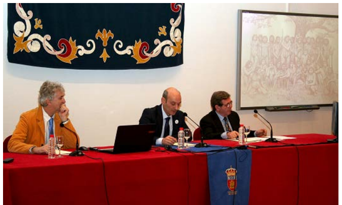
(23 de febrero de 2015)