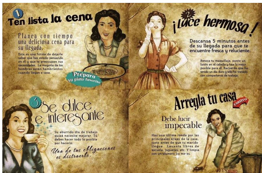
Figura 6. Guía de la buena esposa