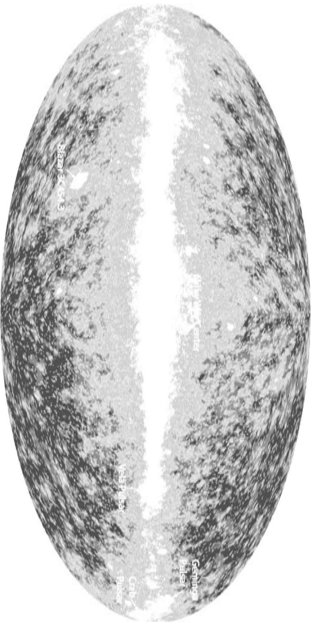
Figura 2. Primer mapa de rayos gamma del cielo proporcionado el 28 de agosto de 2008 por el equipo del telescopio Fermi. La imagen, en colores falsos, toma como referencia el plano de la Vía Láctea (“Milky Way”), que se coloca en el centro. A lo largo de él se observa una nube de rayos gamma producida por la difusión de rayos cósmicos de alta energía en el gas y polvo interestelar. Se han destacado algunas fuentes muy intensas de rayos gamma, como estrellas de neutrones o púlsares, y galaxias distantes muy activas, conocidas como “blazars”. Este mapa es el resultado de tan sólo cuatro días de observaciones, y la información es equivalente a la que podía obtenerse con la anterior generación de telescopios en un año 65 .