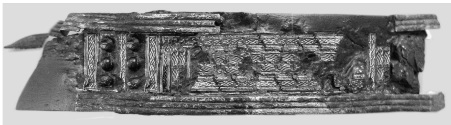
Fig. 1. La pieza después de la limpieza y consolidación.