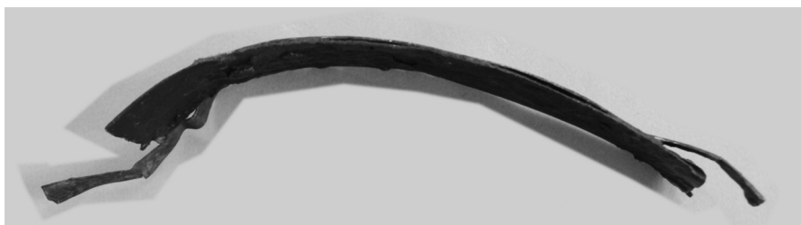
Fig. 2. Perfil y parte inferior de la pieza.