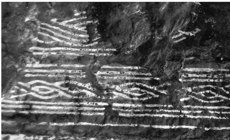
Fig. 4. Detalle de los hilos de plata damasquinados.

dijimos en su día, es la tumba más antigua de la necrópolis y nos interesa el dato de que en la primera vaina citada, probablemente, los surcos marcados por el buril ya no tenían incrustados los hilos de plata que tienen los puñales y las vainas de Miraveche. Los cambios artísticos que introducen las piezas de Villanueva de Teba han sido analizados por uno de nosotros (37) por lo que no hay que insistir. Geometrismo, simetría, ausencia de figurativismo, adaptación al marco, elementos plásticos, disposición en bandas decorativas, repetición de motivos, motivos reducidos, composiciones abigarradas, dan una idea del gusto estético de aquellas gentes que dentro de unas bases heredadas no reflejan el mundo figurativo de otras manifestaciones artísticas vinculadas a grupos más orientales. La decoración de los puñales ya no tiene nada que ver con el mundo de Miraveche siendo, por ahora, modelos específicos.