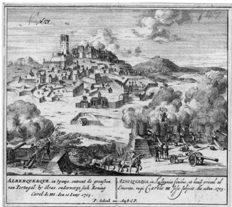
Alburquerque en 1705