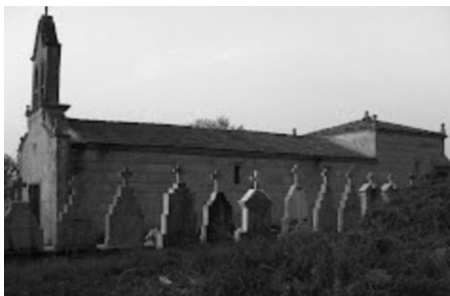
Iglesia y enterramientos de San Esteban de Ambia, parroquia natal del linaje de los de Santiago

He de señalar, para que quede constancia, que en San Esteban de Ambia señoreaba la familia de los Sotelo, siendo patrono, en 1487, don Gonzalo Rodríguez Sotelo (11). Y que su población, en el primer tercio del siglo XIX, era de 129 vecinos o unos 580 habitantes, si se le aplica un coeficiente de 4,5 (12), sabiendo, además, que el lugar y coto de Ambia (13) realiza su censo catastral y vecinal el día 26 de mayo de 1752