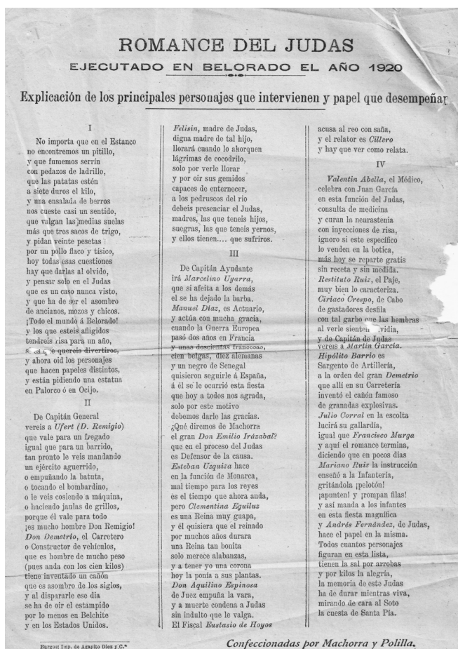
Hoja correspondiente al Romance del Judas ejecutado en Belorado, en 1920

Transcribimos a continuación el Romance , tal como se consigna en la hoja volandera: