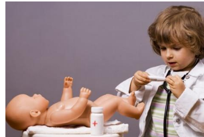
El juego simbólico