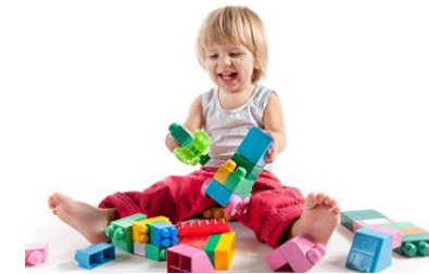
La imitación diferida

La representación requiere cierto grado de auto-reflexión sobre la relación entre el símbolo (significante) y el objeto representado (significado) Carlson y Zelazo (2008)