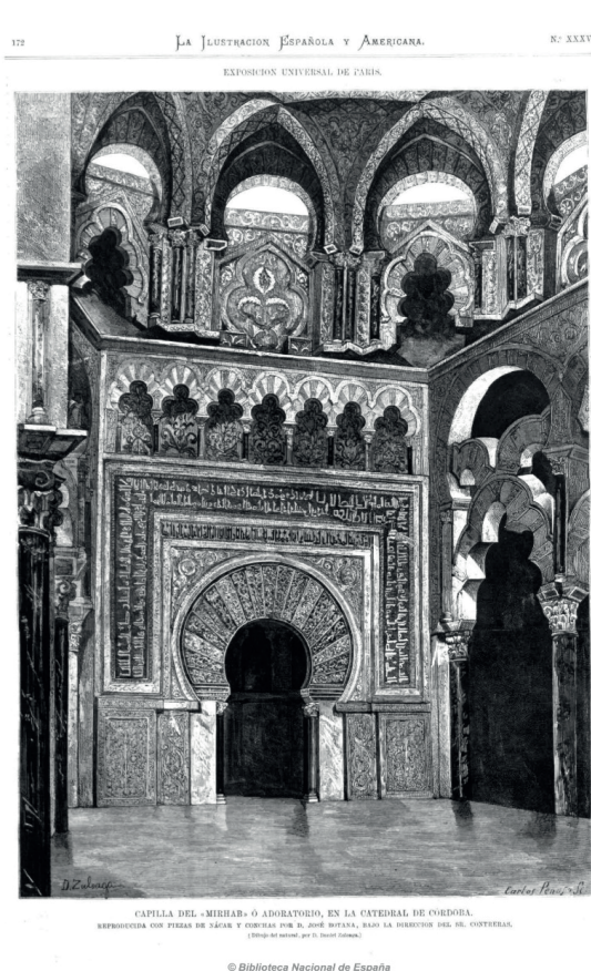
Imagen 5 Copia de la capilla del mihrab de la mezquita de Córdoba exhibida en la Exposición Universal de París dibujada por Daniel Zuloaga, La Ilustración Española y Americana , 22 de septiembre de 1878

otras naciones 106 . Por el contrario, en esa misma publicación ilustrada, unos días después, se recoge una elogiosa referencia al incluirla en el tipo de obras que representa ciencias, arte o antigüedad histórica 107 . En esta revista se encuentra, también, la referencia más extensa del proyecto donde explica, con cierto detalle, el papel protagonizado por cada miembro de la sociedad, acompañándose de una preciosa ilustración basada en un dibujo de Daniel Zuloaga, hermano de Guillermo, quien también colaboró en el trabajo 108 (Imagen 5).