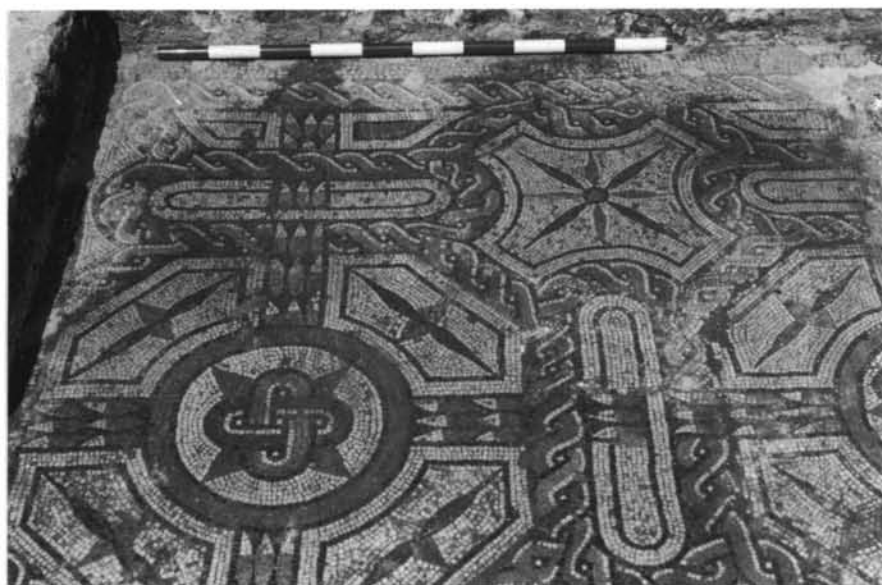
1. Detalle del mosaico geométrico de la cabecera de la habitación n.º 11. 2. Piso de la habitación n.º 14 con decoración de octógonos combinados con cruces griegas.