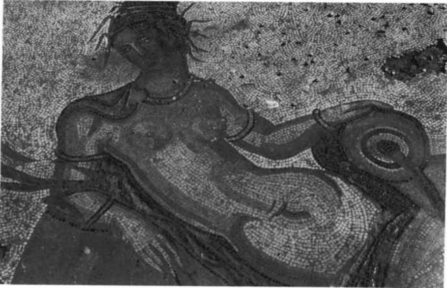
1. Habitación G. Mosaico figurado que representa el baño de Pegaso. 2. Detalle del pavimento musivo de la habitación G. Figura de la fuente Hipócrene.