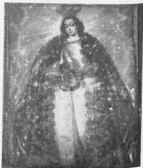
2. Inmaculada, por Mateo Cerezo. En el retablo número 1.