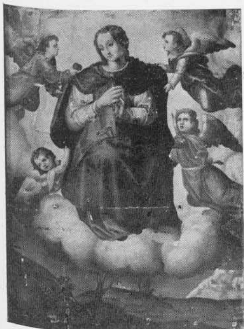
Revilla Vallejera.—La Anunciación. Segunda mitad del siglo XVI.