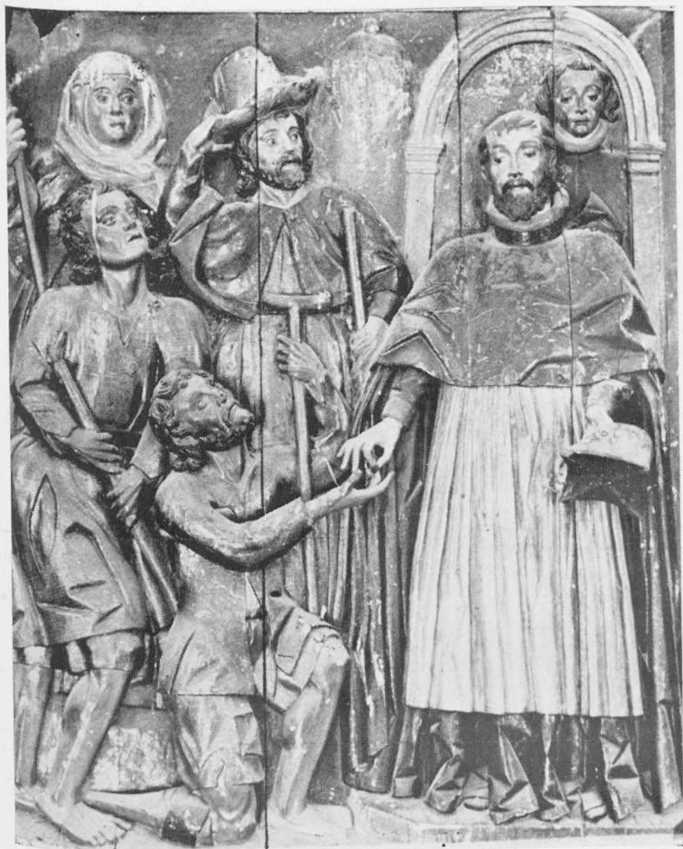
1.º SAN JUAN DE SAHAGUN.—Escultura del retablo mayor de la iglesia de Vallejera (Por Juan de los Helgueros)