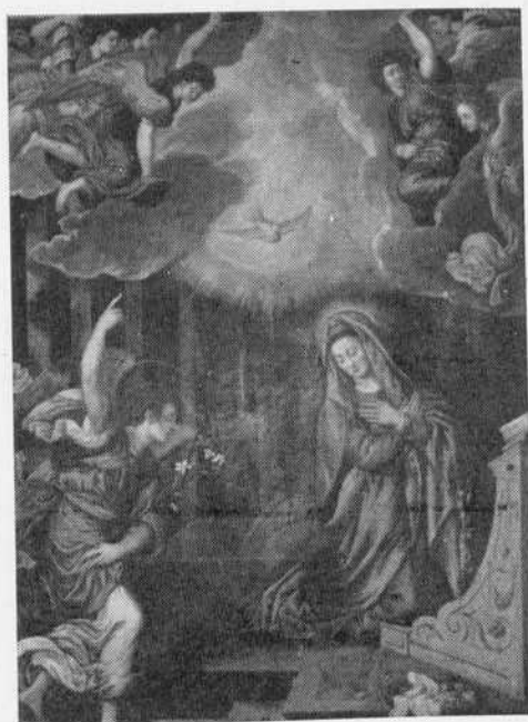
Vallejera.—La Anunciación.—Año de 1572.