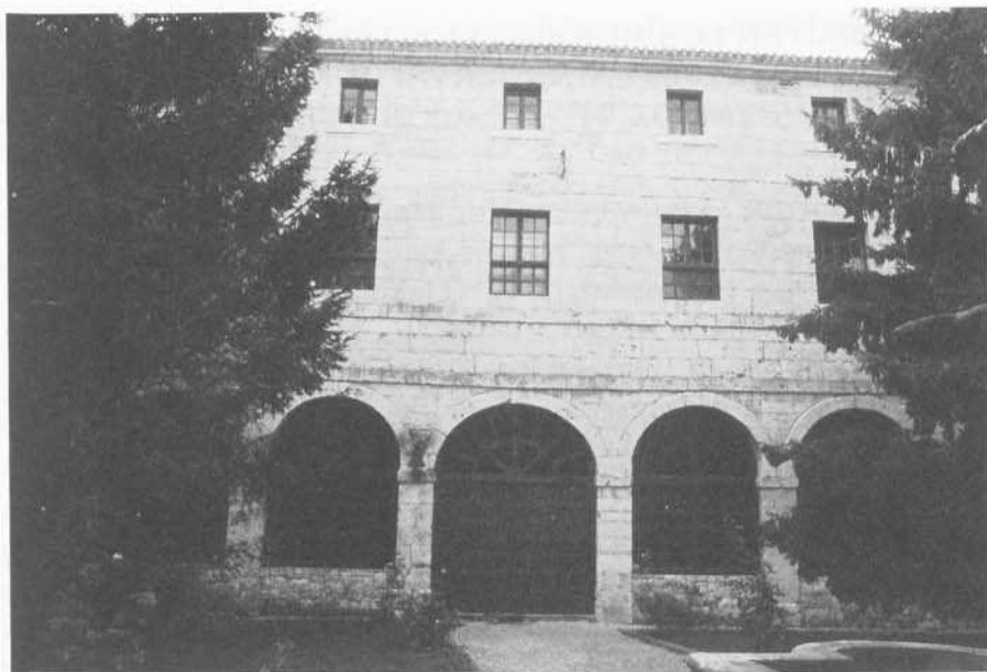
Monasterio de San Pedro de Cardena. Claustro.

mo es habitual en los proyectos de este maestro, la superposición de los órdenes es el elemento interador. Ellos enmarcan los dos cuerpos de hornacinas laterales bajo los característicos frontones de diversa factura y, adaptándose a una distribución simétrica de simbólica facialidad, culminan en el alto coronamiento que está presidido por la imagen de la titular y el escudo del patrono. El medido ritmo ascendente con una reducción de proporciones y plasticidad, el desviaje de plintos y entablamentos o los cuidados efectos de claroscuro, todo ello se halla concebido desde una visión ordenadora que, pese a su imperioso dinamismo, se establece escrupulosamente de acuerdo a sencillas cuadrículas. He aquí un brillante epílogo para la trayectoria que, desde el legado clasicista, había ido reelaborando nuestro maestro a lo largo de su incesante actividad.