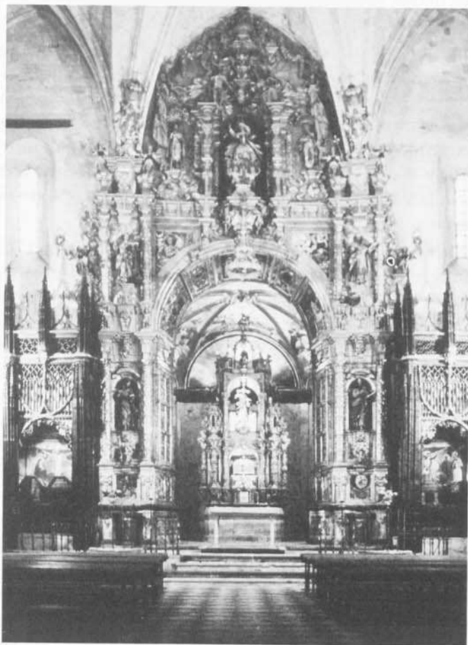
Monasterio de San Salvador de Oña. Retablo mayor y camarín.

Santa María del Mercadillo, cuya construcción se contrata en 1762 (108). No obstante esta permanente presencia de los maestros religiosos en el arte burgalés y el predominio de las empresas ligadas al mundo eclesiástico están alcanzando su postrera expresión ante las nuevas exigencias de titulación académica y el proceso de secularización emprendido desde instancias del gobierno ilustrado (109).