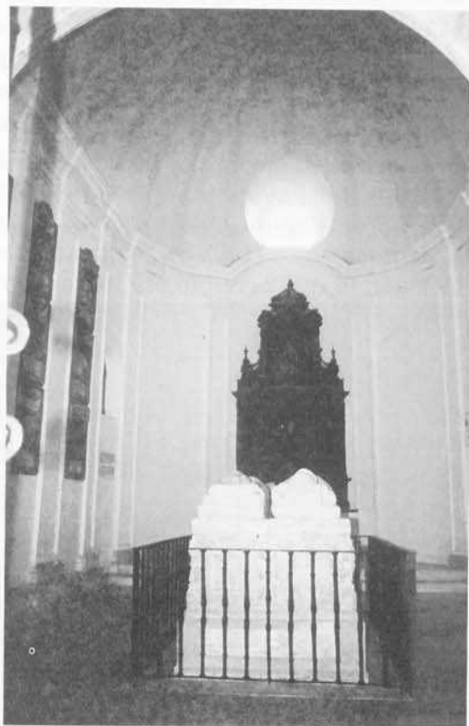
Monasterio de San Pedro de Cardena. Capilla de las Reliquias o de El Cid.

todo ello culmina con la habitual exaltación mariana. Su esquema compositivo revela un dinámico ritmo ascendente que se acentúa mediante el profuso abigarramiento ornamental cuyos motivos, tallados de forma nerviosa y vibrante, combinan el repertorio naturalista con temas que preludian la rocalla (Fig. 4).