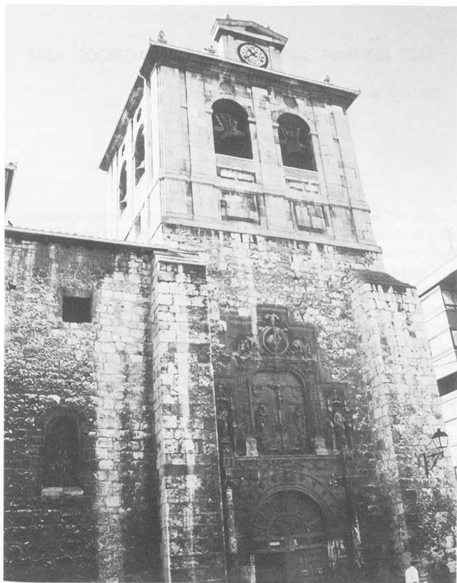
Fig. 3. Torre de la iglesia parroquial de San Cosme y San Damián.