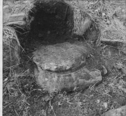
Basa de columna en Cerro Grañón

ción de las peregrinaciones jacobeanas. El discurrir del actual trazado del camino de Santiago unos centenares de metros al sur de la presunta vía romana puede explicarse a partir de la paulatina concentración en la localidad de Grañón de sus dispersos barrios medievales, un movimiento que pudo haberse iniciado ya desde comienzos del siglo XII (10).