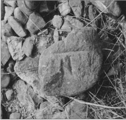
Piedra epigrafiada en el solar de San Martín