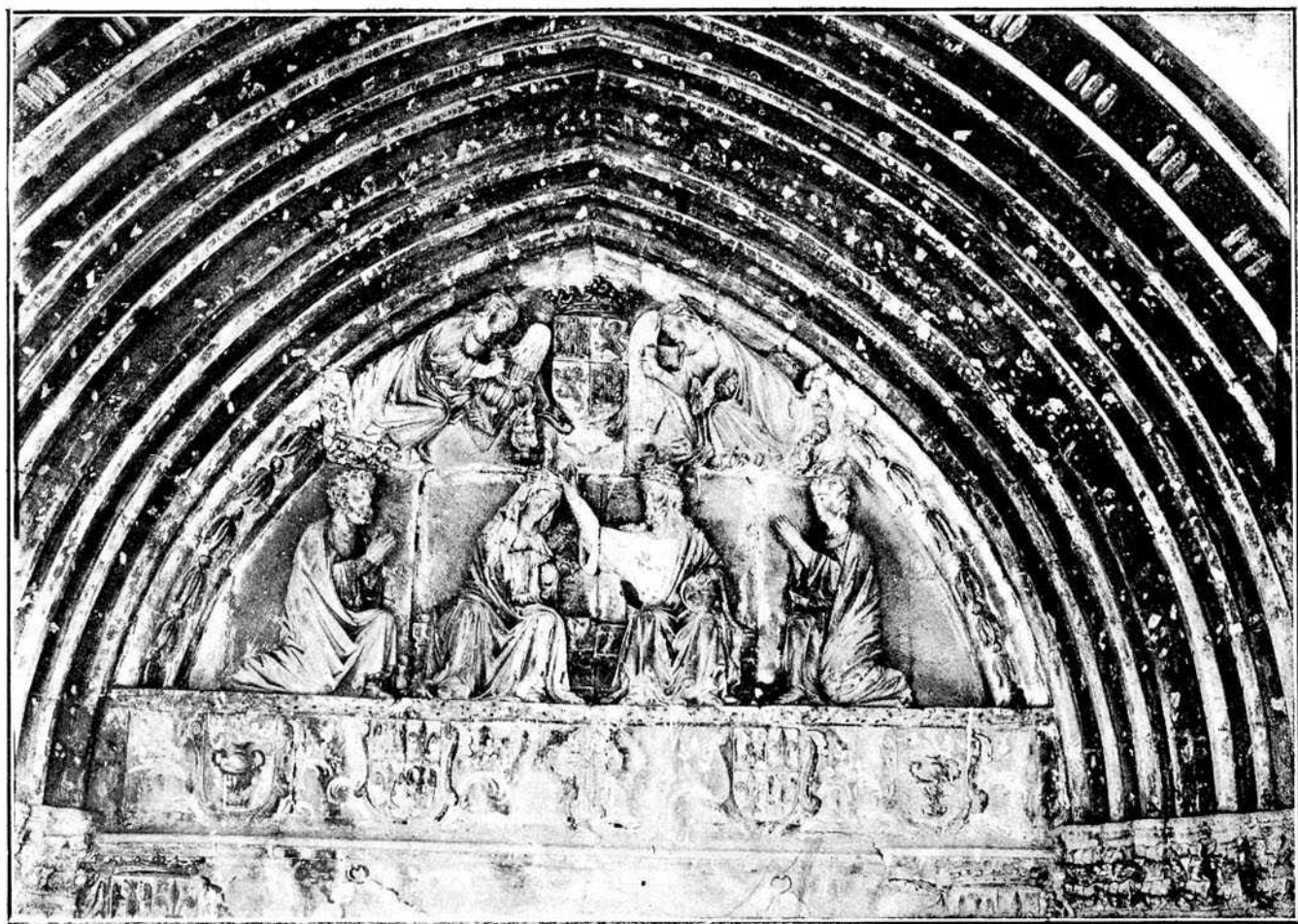
Iglesia de Santa María la Real de Gamonal.—Tímpano del arco de entrada (s. XIII)