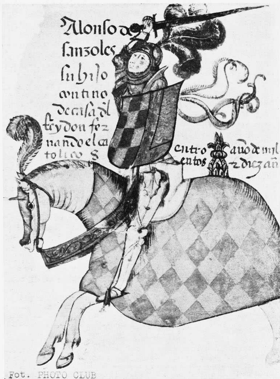
(Fot. n.º 3) — "Libro de la Regla de la R. Cofradia de Santiago" Retrato ecuestre del Caballero Alonso de Sanzoles.