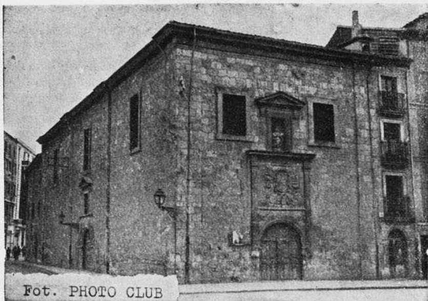
Fotogr. núm. 1.—Convento de RR. Franciscanas Concepcionistas de Burgos. (Exterior de la Iglesia).