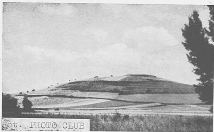
La Riba Redonda.