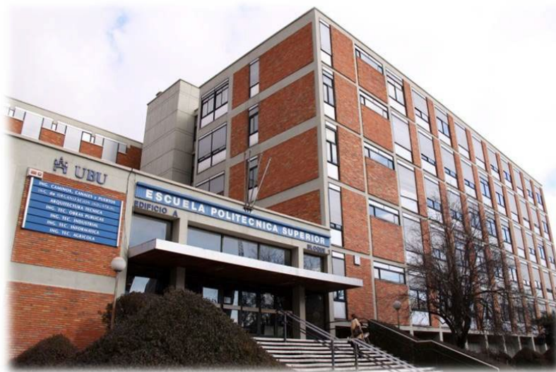
Imagen 2. Vista principal del Campus Vena de la EPS

El Departamento de Digitalización tendrá su sede en la Escuela Politécnica Superior de la Universidad de Burgos y su profesorado impartirá docencia en las distintas titulaciones y campus a las que se adscriba.