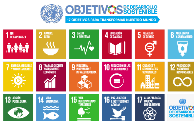
Figura 2. Objetivos de Desarrollo Sostenible.

La Universidad de Burgos ha colaborado con el Ayuntamiento de Burgos en la implantación de la Agenda 2030 como eje transversal de las políticas municipales con la redacción de los informes realizados por el equipo de la Universidad de Burgos (Vicente & Gómez, 2021) elaborados de acuerdo con el marco de indicadores mundiales propuesto por las Naciones Unidas, así como de algunos elaborados por los propios grupos de trabajo (Figura 2).