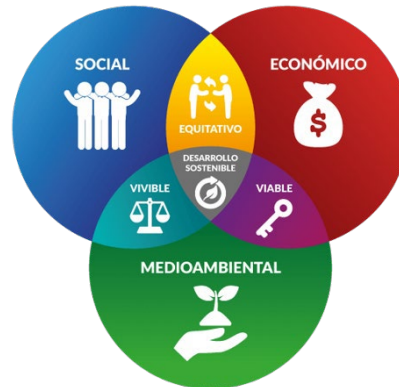
Figura 1. Esquema de las esferas medioambiental, social y económica de la Estrategia de Desarrollo Sostenible 2030.