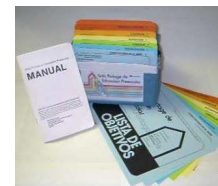
Tabla 1. Objetivos y fichas por área de desarrollo en la Guía Portage.