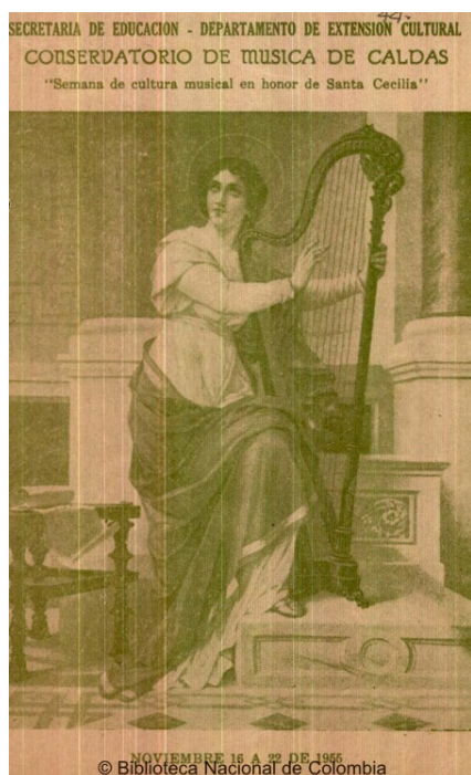
Portada: Concierto (1955)