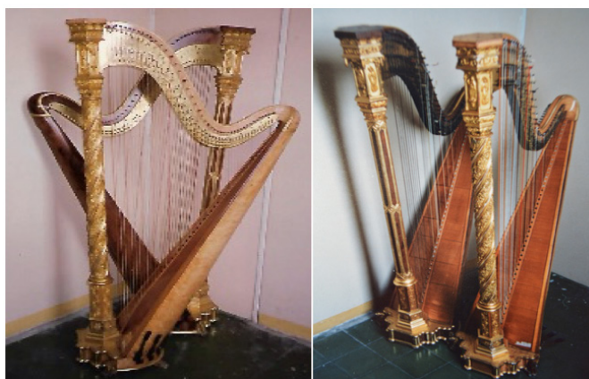
Arpas Érard. Conservatorio de Música (Manizales)