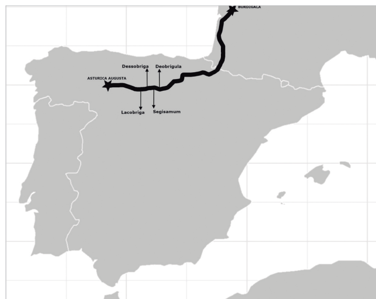
Fig. 1. Recorrido de la Vía Aquitana. Elaboración propia

La vía 34 de hispania in aquitaniam ab asturica burdigalam del Itinerario de Antonino era uno de esos caminos (Fig. 1). Cruzaba el valle del Duero de Este a Oeste al pie de la Cordillera Cantábrica, con un trazado en parte coincidente con otras dos que también se mencionan en el mismo documento (la 1 y la 32). El cualitativo y cuantitativo avance que se ha producido en la investigación en los últimos